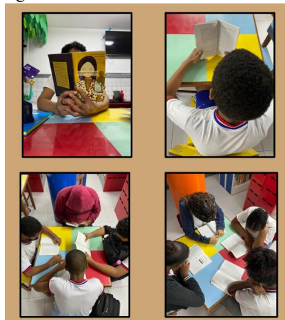
Figura 1 – Aulas de leitura na biblioteca

No primeiro intervalo, os alunos foram indagados quanto às dificuldades na leitura e no vocabulário do livro; assim, foram instruídos a realizar pesquisas no dicionário e a consultar o glossário encontrado nas últimas páginas do livro, com o significado de termos e expressões próprias da cultura oriental.