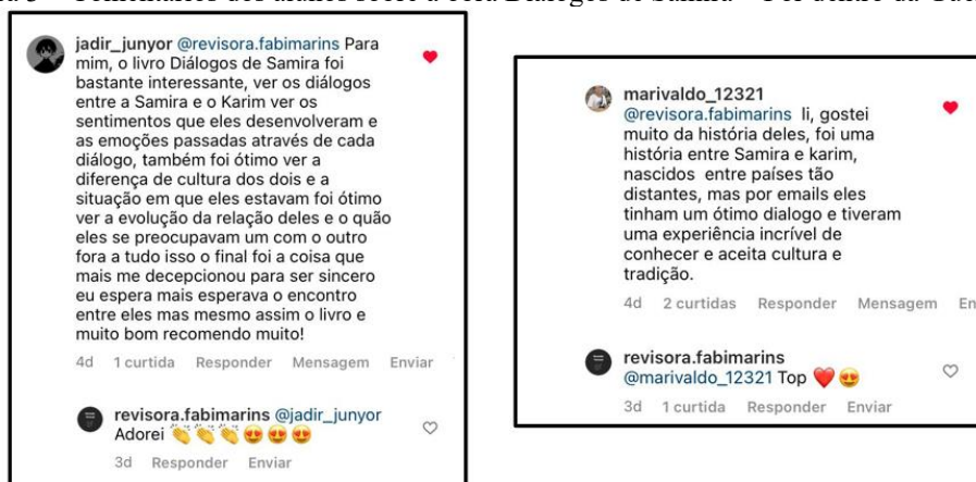
Figura 3 – Comentários dos alunos sobre a obra Diálogos de Samira – Por dentro da Guerra Síria