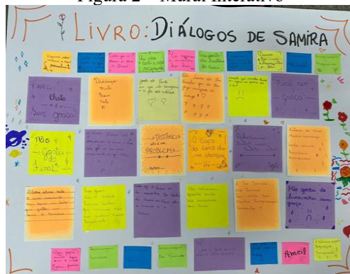
Figura 2 – Mural Interativo

6ª etapa - Os educandos desenvolveram um mural interativo com base no padlet - mural interativo virtual. Devido a algumas dificuldades relacionadas ao acesso à Internet e ao material digital, encontradas na proposta inicial com o uso do mural virtual, os alunos fizeram manualmente o trabalho que seria feito virtualmente. Para isso, foram colados post-it com comentários e opiniões dos alunos sobre o livro em uma cartolina que foi exposta em um mural na sala de aula.