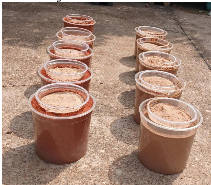
Figura 2 - Materiais homogeneizados e moldados em moldes secando naturalmente.

Como agente aglutinante foi utilizada cola natural preparada a partir da tapioca, vinagre e água, submetidas ao aquecimento até obtenção de consistência viscosa. Os materiais de cada tratamento foram homogeneizados manualmente com o aglutinante até formação de massa moldável, sendo posteriormente compactados nos moldes. Após a moldagem, os recipientes foram submetidos à secagem natural por 48 a 72 horas em ambiente protegido. Posteriormente, foi aplicado impermeabilizante natural goma laca, para reduzir a absorção de água e aumentar a estabilidade estrutural durante o período de viveiro (Figura 2).