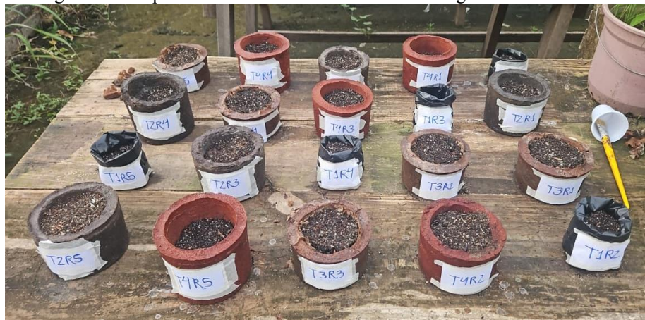
Figura 3 - Recipientes sustentáveis confeccionados e organizados em viveiro.