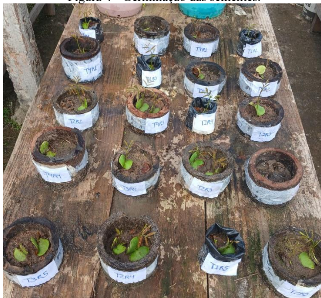
Figura 4 - Germinação das sementes.

O semeio foi realizado manualmente, utilizando-se duas sementes de Magonia pubescens por recipiente. Previamente à semeadura, todas as sementes foram submetidas à quebra de dormência por meio de imersão em água por 24 horas. As mudas permaneceram sob condições de viveiro durante todo o período experimental, sendo submetidas a manejo hídrico conforme a demanda da cultura, visando manter condições adequadas ao crescimento inicial (Figura 4).