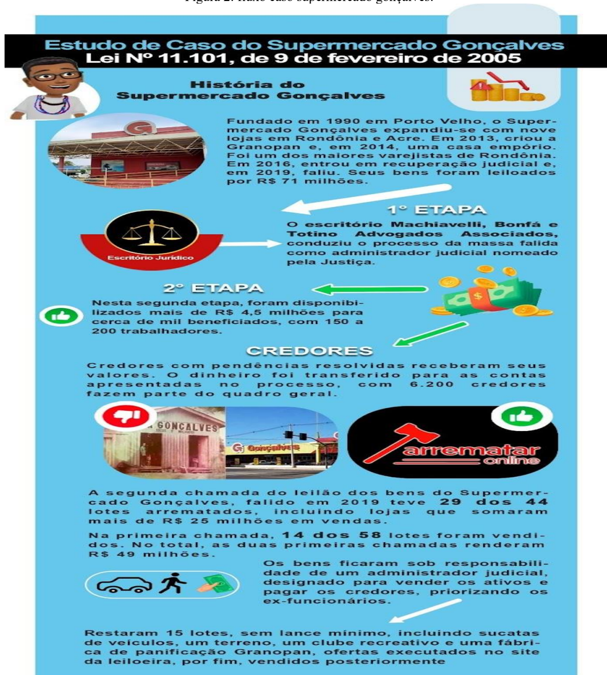
Figura 2: fluxo caso supermercado gonçaves.

De acordo com a legislação brasileira (Brasil, 2005), a recuperação judicial e a falência possuem objetivos distintos: a primeira visa a preservação da empresa, e a segunda, a sua dissolução. A definição pelo procedimento mais adequado exige uma análise minuciosa da situação financeira do devedor, com a finalidade de otimizar o retorno aos credores e, quando viável, assegurar a manutenção da atividade empresarial, dos postos de trabalho e de sua função social.