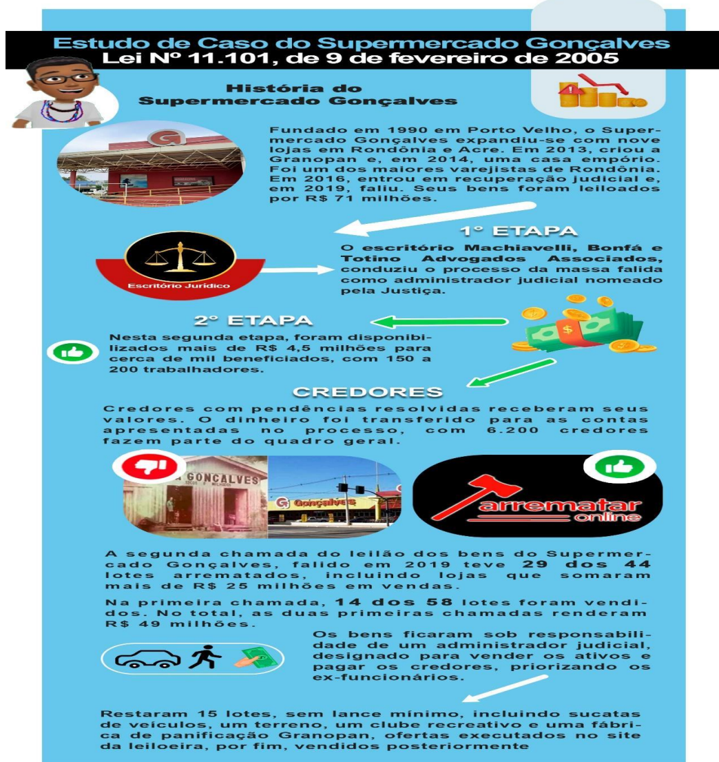
Figura 1: produto educacional infográfico do caso supermercado gonçalves.

Este trabalho foi desenvolvido por meio de uma metodologia de pesquisa bibliográfica. A primeira etapa consistiu em um levantamento doutrinário e teórico, abrangendo a legislação pertinente, a produção acadêmica sobre recuperação de empresas e falência, e estudos sobre o uso de recursos visuais no direito. Em um segundo momento, partiu-se para a análise concreta do caso Supermercado Gonçalves, com a consulta direta aos autos do processo de recuperação judicial e falência, registrados no Tribunal de Justiça de Rondônia. A partir desses insumos, construiu-se um infográfico analítico, que sintetiza a trajetória do grupo por meio de elementos visuais como linha do tempo, fluxogramas processuais e diagramas que ilustram os impactos socioeconômicos do caso.