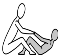
Figura 3 – Relacionamento “partilhado”