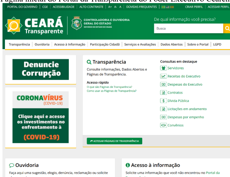
Página inicial do Portal da Transparência do Poder Executivo Cearense