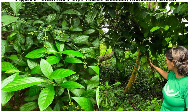
Figura 5. Chacrona e Cipó Mariri. Bananal, Maranhão, Brasil.

O preparo do chá, que pode durar no mínimo 7 dias em panelas de 100 litros cuidadas pelo “guardião do fogo” que averigua o cozimento dos folhos da Chacrona e do Cipó Mariri (Figura 06), apresenta uma forma de produção que foge da extrema industrialização, mas que promove a melhor segurança e qualidade do produto como a utilização de técnicas para se obter a melhor extração e armazenamento preservando as propriedades do chá (Quadro 1).