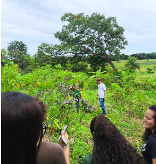
Figura 4. Agrofloresta. Bananal, Maranhão, Brasil.

Pimentel (2022) destaca que a agroecologia insurgente em territórios tradicionais do Sul da Bahia e de outras regiões brasileiras fundamenta-se na ancestralidade como pilar para a conservação da biodiversidade. O plantio e manejo de espécies nativas e frutíferas deixa de ser apenas um fator de subsistência para a comunidade e passa a ser um ritual religioso de manutenção da verde sagrado e do Axé (força vital), levando a preservação não só ambiental, mas também cultural criando uma associação de fortalecimento mútuo. Sendo assim, o cultivo de plantas de propriedades medicinais é erguido por esse pilar religioso bem como científico, formando a agrofloresta como uma possível “farmácia viva” (Figura 4).