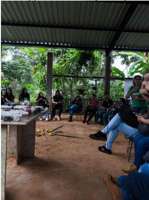
Figura 2. Recepção dos alunos e Apresentação do Projeto.