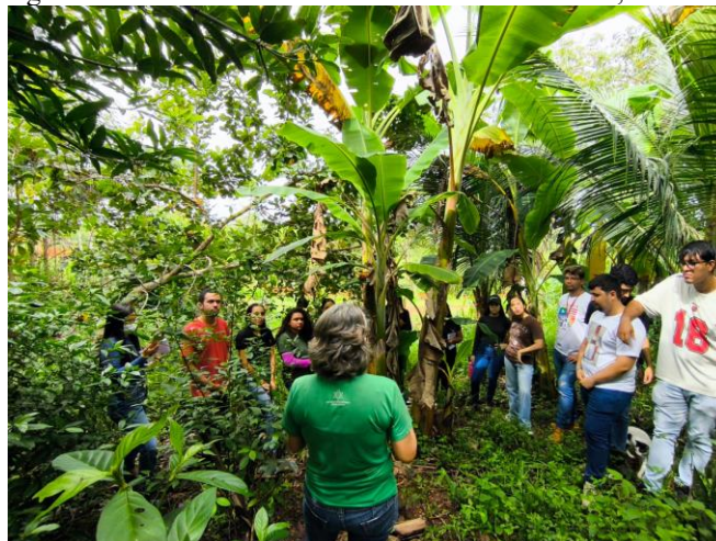
Figura 3. Agrofloresta da Comunidade Mãe de Deus. Bananal, Maranhão, Brasil.

A comunidade possui um sistema de Agrofloresta produtivo, desenvolvido através de mecanismos técnicos, como a utilização de espécies adequadas para recuperação e produção, que atendem as demandas da comunidade e aparatos para tratamento do solo que evitem erosão (Figura 03).