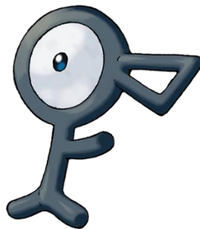
FIGURA 3 – Unown

Os Unown ( Figura 3) ocupam posição estratégica na narrativa porque representam uma força simbólica ligada à linguagem, à formação de signos e à produção de realidade. Como criaturas associadas a letras e à decifração, eles podem ser lidos, no plano metafórico, como uma imagem da alfabetização em estado bruto: potência de composição sem direção crítica, forma sem mediação interpretativa. Nesse ponto, o filme oferece uma reflexão que dialoga com a Educação Geográfica, pois evidencia que signos isolados, quando desconectados da experiência e do sentido, podem sustentar construções frágeis e até perigosas. Rubáš et al. (2024) ajudam a compreender essa questão ao defenderem que o vínculo com o lugar favorece aprendizagens mais profundas, enquanto Souza et al. (2023) assinalam que o ensino perde consistência quando se afasta da realidade vivida do estudante. Os Unown, assim, podem ser entendidos como signos sem ancoragem, capazes de organizar um mundo, mas não de atribuir-lhe humanidade.