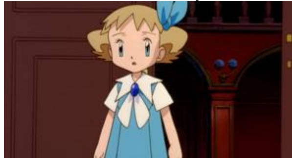
FIGURA 1 – Molly

como articulação entre dinâmicas psíquicas e espaciais, enquanto Serpa (2022) reforça que o lugar não pode ser reduzido à materialidade, já que sua densidade emerge da experiência humana. Em Greenfield, a cidade permanece visível, mas já não corresponde ao mundo compartilhado; ela se torna extensão de uma subjetividade ferida.