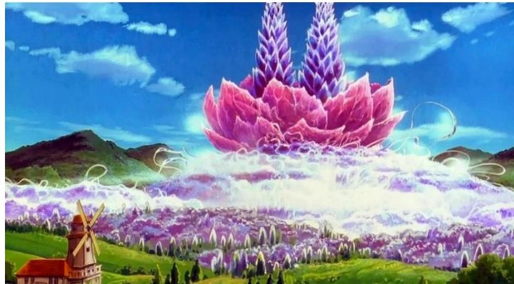
FIGURA 2 – Greenfield e Mansão Hale