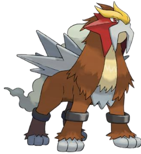
FIGURA 4 – Entei