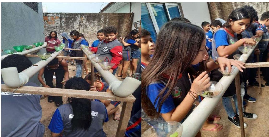
Figura 1: Horta

Relato 2: De acordo com a habilidade EF04CI01 do ensino fundamental, diz que os alunos precisam compreender a relação entre seres vivos e seu ambiente, incluindo práticas sustentáveis. Nesse intuito de desenvolver algo inovador para a escola e alunos, desenvolvemos um projeto cujo objetivo inicialmente é fazer com que os alunos compreendam sobre a educação ambiental na forma de economia de água, através da reciclagem e incentivar a agricultura na escola e a alimentação saudável. “Esse projeto busca incentivar desde cedo a importância da alimentação saudável e o cuidado com o meio ambiente , criando uma base sólida para o desenvolvimento de hábitos e valores positivos” (Santos; Sabei Morais, 2013, p. 45, grifos nossos). Muitos dos alunos ficaram fascinados com a ideia de cultivar as plantas, a técnica hidropônica, que utiliza a água e nutrientes, chama a atenção em ver cada aluno realizado em poder observar de perto o desenvolvimento da horta, tornando o aprendizado mais significativo e dinâmico.