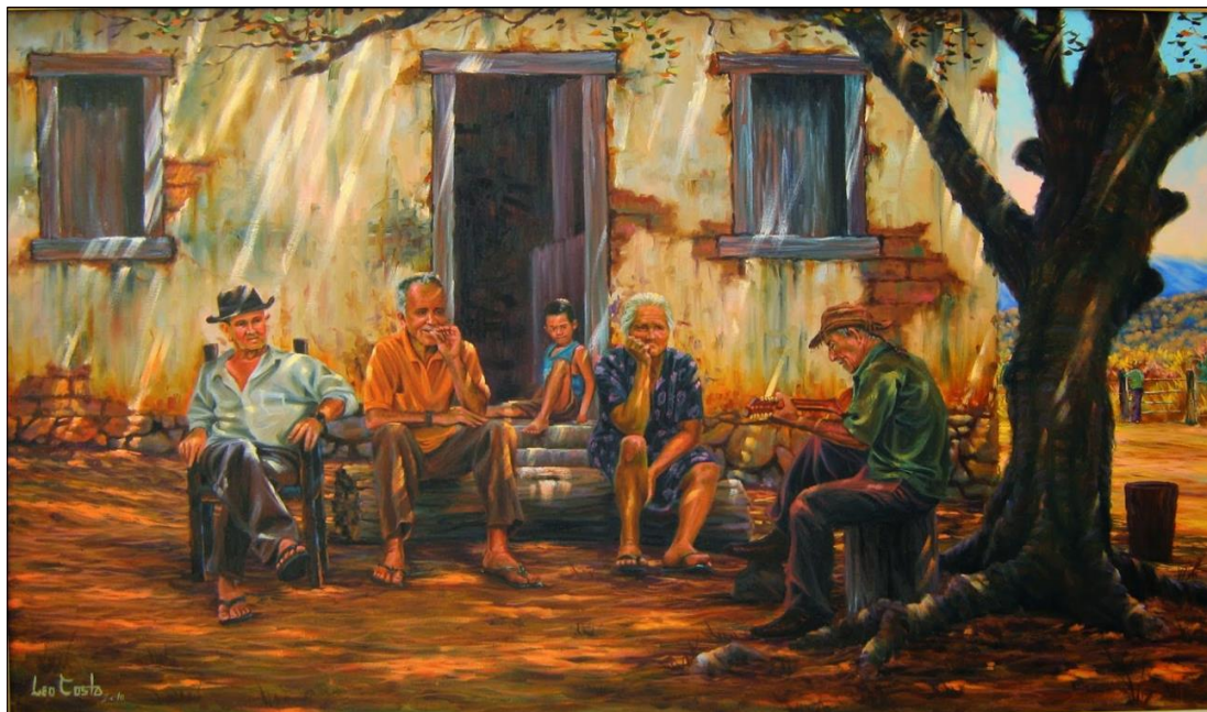
Léo Costa. Viroleiro do Sertão. 2010. Pintura. Disponível em: https://leocostaartes.blogspot.com/2011/02/violeiro-do-sertao.html . Acesso em: 2 mar. 2026.

nesse ponto, não se limita à presença de múltiplos personagens, mas envolve a constituição de uma cena de convivência coletiva, em que o encontro entre sujeitos e a partilha de uma experiência comum se tornam elementos estruturantes.